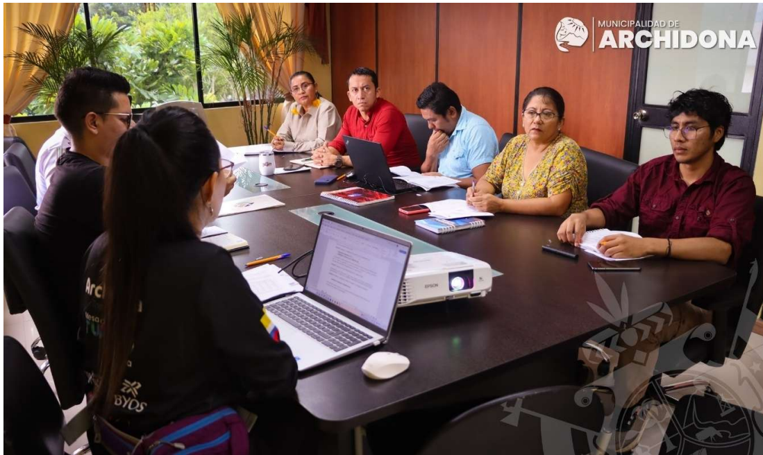
REUNION CON LA FUNDACIÓN JOCOTOCO