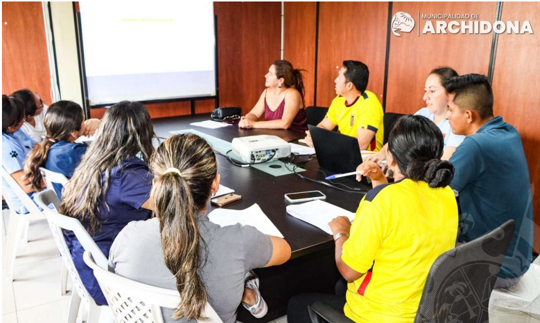
TALLER DE CAPACITACIÓN DE LA DIRECCION NACIONAL DE CAPACITACIÓN DNMAP -CGE